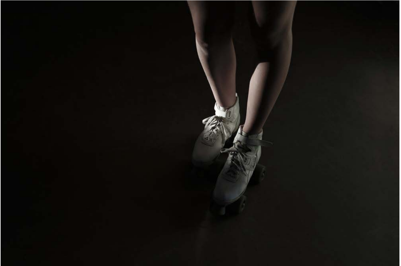
DRAGONFLY - MERCURE © CAROLINE CHEVALIER

Caroline Chevalier est née à Grenoble en 1978.