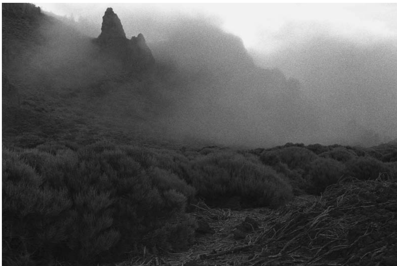
JOURNAL DE L'ŒIL

Anne-Lise Broyer est née le 6 avril 1975, vit et travaille à Nogent-sur-Marne.