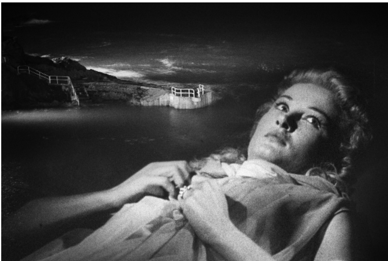
LES INCONNUES DE LA SCÈNE © MARIE MAUREL DE MAILLÉ

Marie Maurel de Maillé est née à Lyon en 1978, et vit actuellement à Paris.