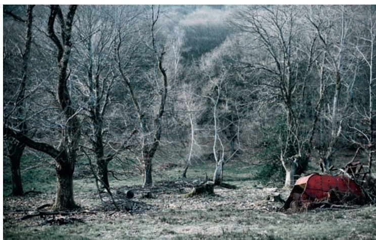
La Bergerie, 2010