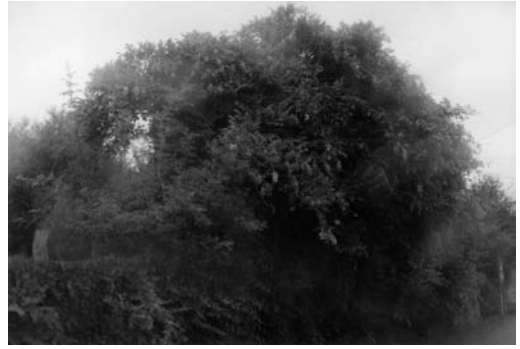
La Bergerie, 2010 // // // Bourgneuf, 2011 // // // Mourioux, 2011