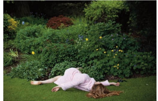
it was so beautiful I died

" This series started as a way to pass the time during a quiet vacation in Yorkshire visiting my 90 year old great uncle, and quickly became a serious endeavour following the strong positive reaction I got from friends and other photographers. In these photos and in many of my street photos, I'm looking for the absurd side and the humour in life. A sense of mystery, and often a sense of being alone. At least this is what comes across in my photos more and more whether intentional or not. I'm very serious about my work, but in general I don't feel grounded. I feel like I could just die at any moment and nothing I do is important. Maybe lots of people feel like this leading up to the infamous age of 27. Like the landscapes in these photos, the world would just go on without me. But hey, if we're all going to die, might as well have an epic final vision!