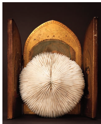
© Magali Lambert, Eres una Maravilla (Tu es une merveille) , 2013

“Une fois les paupières closes, nous basculons de l’autre côté de l’éveil, nous partons piocher dans les contenants de toute une vie : coffre à jouet, armoire de classe de biologie, vitrine d’antiquaire, de collectionneur, de grandmère, magasin de bibelots, échoppe pour touristes, garde-meuble, garde-manger, boîte à bijoux, cartons entassés dans une maison vide... Ce que nous prélevons dans nos musées nocturnes, notre esprit le fragmente, le mélange, le recompose, et ces trouvailles reconstituées forment le décor et les protagonistes de nos rêves, de nos cauchemars. Magali Lambert nous est semblable, à cette différence près qu’elle pille les yeux ouverts. C’est une ouvrière du songe qui opère au grand jour, une inventrice d’onirique exilée dans la conscience. Elle tamise les vide-greniers, les marchés, les rues, les tiroirs oubliés, garde ce que nous n’avons pas retenu, ce que la vie a délaissé mais que le temps a conservé, ce qui aurait pu être jeté pour de bon mais semble avoir été sauvé de la destruction par son insignifiance même. De ce matériau brut, de ces éléments pauvres, désuets, cassés ou rococos, naturels ou artificiels, elle tire des créations, des machines à mettre en marche l’imagination, à la familiarité troublante, presque dérangeante tant il est perturbant de retrouver dans la vraie vie ce qui ne s’actionne que dans le sommeil”. (Extrait d’un texte de Thibault Marthouret).